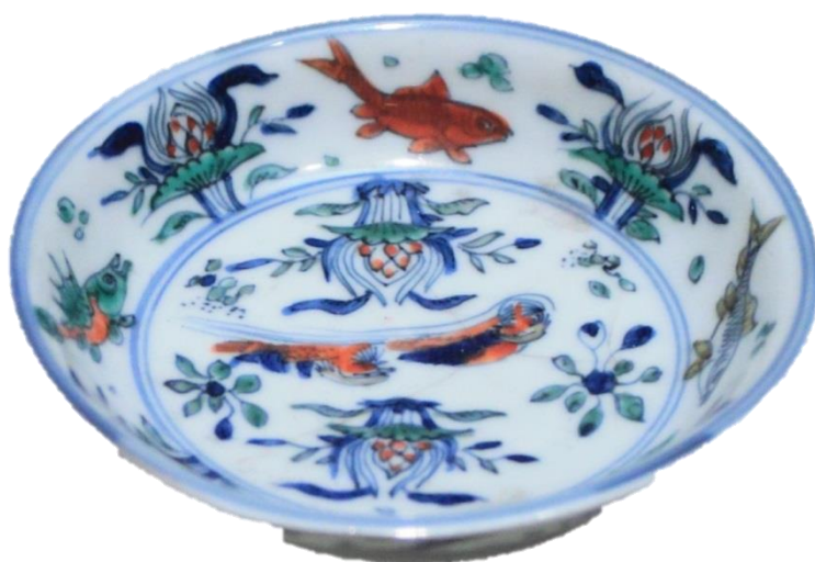
鬥彩魚藻紋小碟(明)